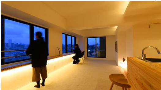
Produced by STUDIO KAZ

今や住まいづくりのテーマは『ライフスタイルの実現』にあります。その中心的存在がキッチンなのはあたりまえです。それなのに、相変わらず変わり映えないキッチンばかり。住まい手に寄り添ったキッチンをどうつくるか。どうしたら自分だけのキッチンが実現するのか。